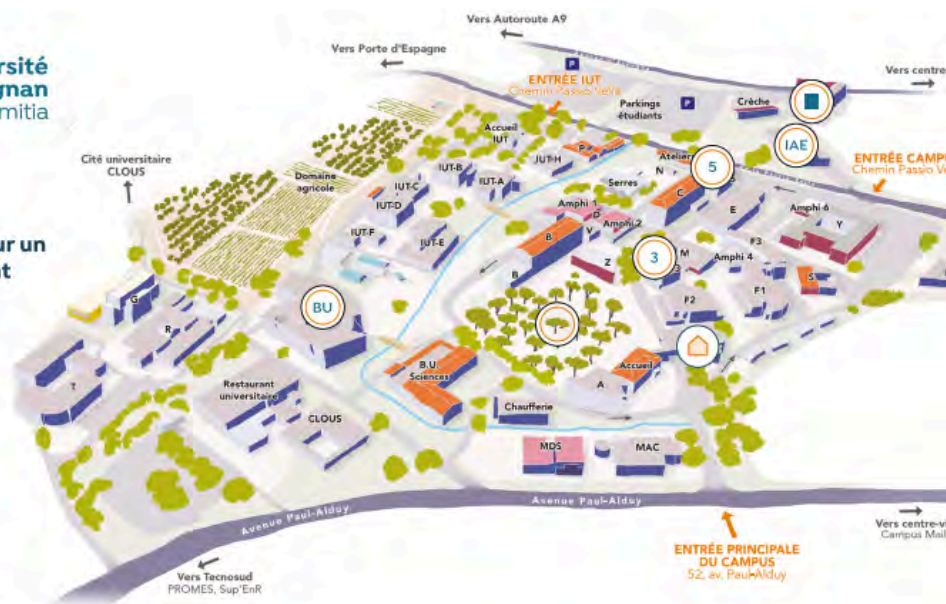
Plan campus Moulin-à-Vent

Journée Transition écologique pour un développement soutenable 25 mars 2025