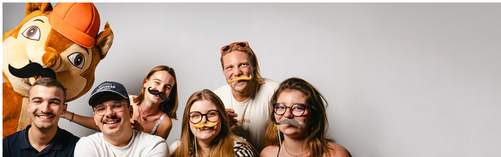
Dans cette campagne de sensibilisation, l'UPVD et la Fondation UPVD ont pu compter sur la précieuse implication des membres du Conseil des étudiants (CDE).

En cas de doute, consultez votre médecin.