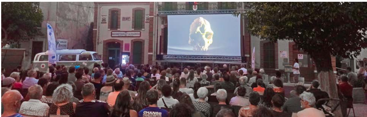
Le 24 juillet, le documentaire a été projeté en avant-première sur la place du village de Tautavel devant un auditoire attentif.

Le documentaire, produit par Tangerine productions, Minimum Moderne, Les Fées spéciales et France Télévisions, a été soutenu par la Région Occitanie/Pyrénées-Méditerranée. Il sera présenté d'ici la fin de l'année sur France 5 en prime time dans l'émission Science Grand Format . En attendant sa diffusion, une bande d'annonce est disponible en ligne sur Youtube.