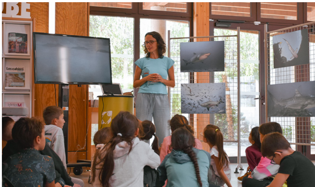
L'atelier « le mythe du requin mangeur d'hommes » du laboratoire CRESEM a captivé les enfants.

Aujourd'hui, la Fête de la Science en France c'est : - plus d'1 M de visiteurs, - 300 000 scolaires, - 5 000 événements répartis sur tout le territoire, en outremer et à l'international.