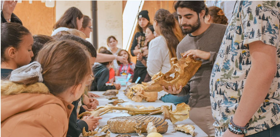
À la rencontre de l'homme préhistorique avec le laboratoire HNHP.

Au mois d'octobre, l'Université de Perpignan Via Domitia, avec le soutien de la Fondation UPVD, de la Région et du ministère de l'Enseignement supérieur et de la recherche, a ouvert ses portes à l'occasion de la Fête de la Science. Les 10, 11 et 12 octobre, l'UPVD a mis en lumière un "Océan de savoirs", offrant aux quelques 2 000 visiteurs une exploration approfondie des mystères marins et des avancées de la recherche scientifique.