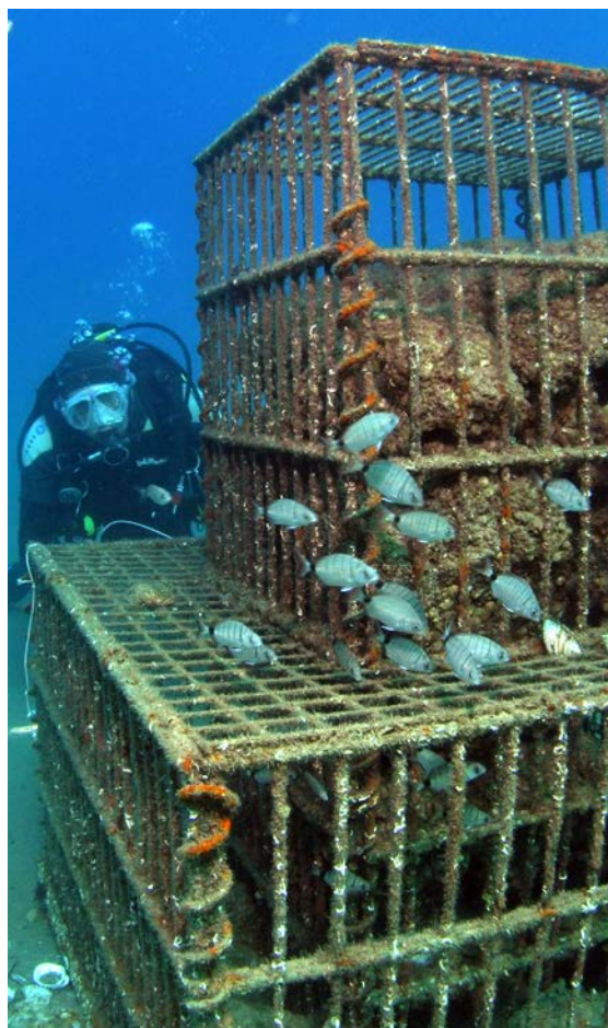
RESMED+ est l'un des projets phares menés sur la zone du littoral. Piloté par le laboratoire CEFREM, il a pour objectif d'améliorer les connaissances sur la qualité des écosystèmes et de la biodiversité, en mettant en œuvre des actions de conservation et de gestion communes.

À travers le programme Interreg Poctefa, l'UPVD est actrice de la géopolitique transfrontalière pyrénéenne et de l'intégration européenne.