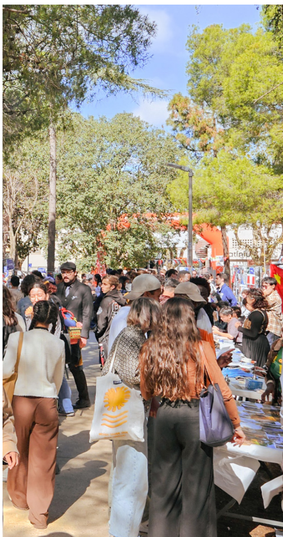
Du 30 septembre au 3 octobre, la traditionnelle « Campus Week » s'est déroulée sous la pinède du campus du Moulin-à-Vent. Chaque journée était consacrée à un thème, permettant de mettre en avant les services étudiants, les partenaires et les associations locales autour du sport, de la santé, de la vie associative et culturelle, ainsi que de l'ouverture à l'international.

Au mois d'octobre, l'Université de Perpignan Via Domitia (UPVD) a organisé sa « Campus Week » et ses « Campus Day » sur les différents sites de l'établissement. Objectif, mettre en avant les services et les partenaires de l'UPVD consacrés à la vie étudiante. Retour en images sur ces événements phares qui ont rythmé la rentrée.