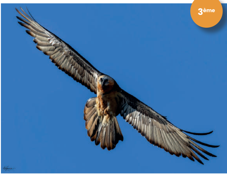
Étang d'Izourt – Ariège / Niel Fantin