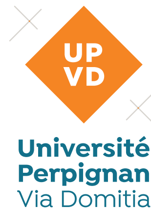
Logo générique vertical sans baseline