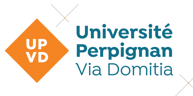
Logo générique horizontal sans baseline