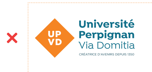
NE PAS SUPPRIMER D'ÉLÉMENTS