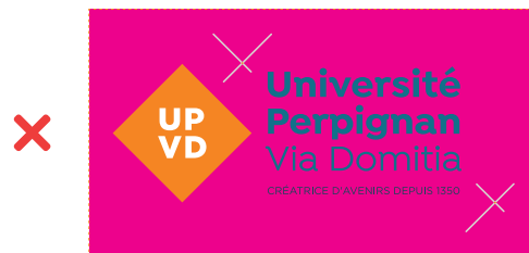
SUR FONDS DE COULEURS NON PRÉVUS