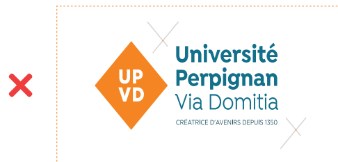
NE PAS DÉFORMER