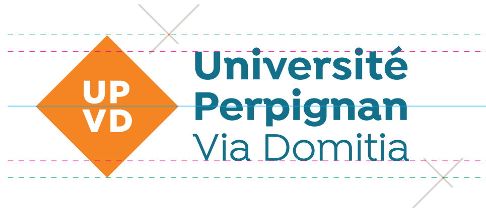
Règles de justification

Lors d'une utilisation externe, quand le logotype est apposé aux côtés de logos partenaires, il sera impératif de respecter ces proportions qui assure la lisibilité. (voir exemple ci-dessous)