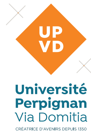
Logo générique vertical