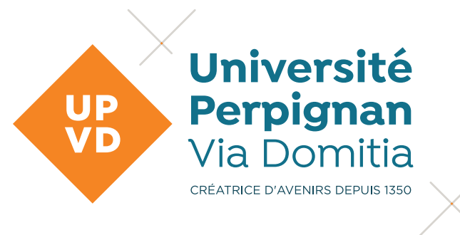
Logo générique horizontal

Le logotype Université de Perpignan Via Domitia existe en deux versions, horizontale et verticale. Elles ont été prévues pour s'adapter aux besoins du support utilisé.