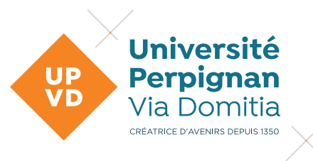
Logo sans baseline