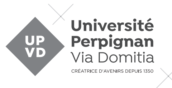
Niveaux de gris

Ces versions sont prévues lorsqu'il y a des contraintes d'impression (marquages d'objets en une seule couleur, journaux imprimés en une couleur avec niveaux de gris, etc).