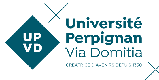
Monochrome Pantone 7470 C