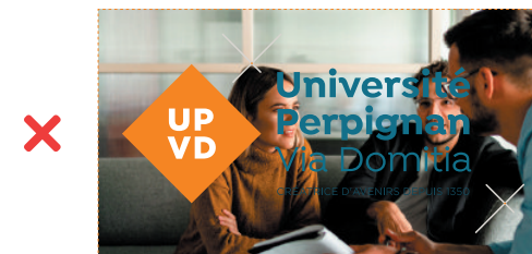
SUR VISELS SANS FILTRE NOIR